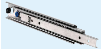
Aluminium Aluminio Alluminio